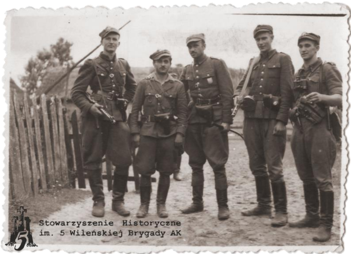
Stowarzyszenie Historyczne im. 5 Wileńskiej Brygady AK